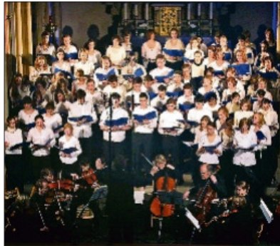
Die Waldorfschüler wagen sich an Mozarts Requiem.